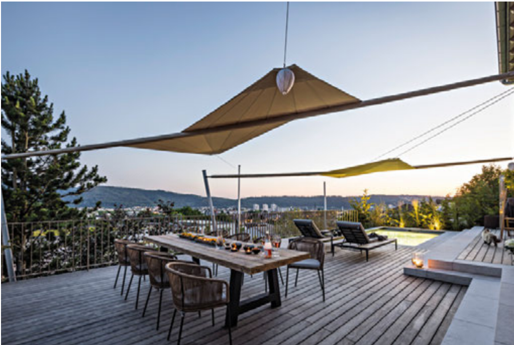
Geschützt vor äußeren Einblicken thront diese Terrasse mit kleinem Naturpool über den Dächern der Ortschaft und eröffnet ein einzigartiges Panorama in die Umgebung und die Natur.