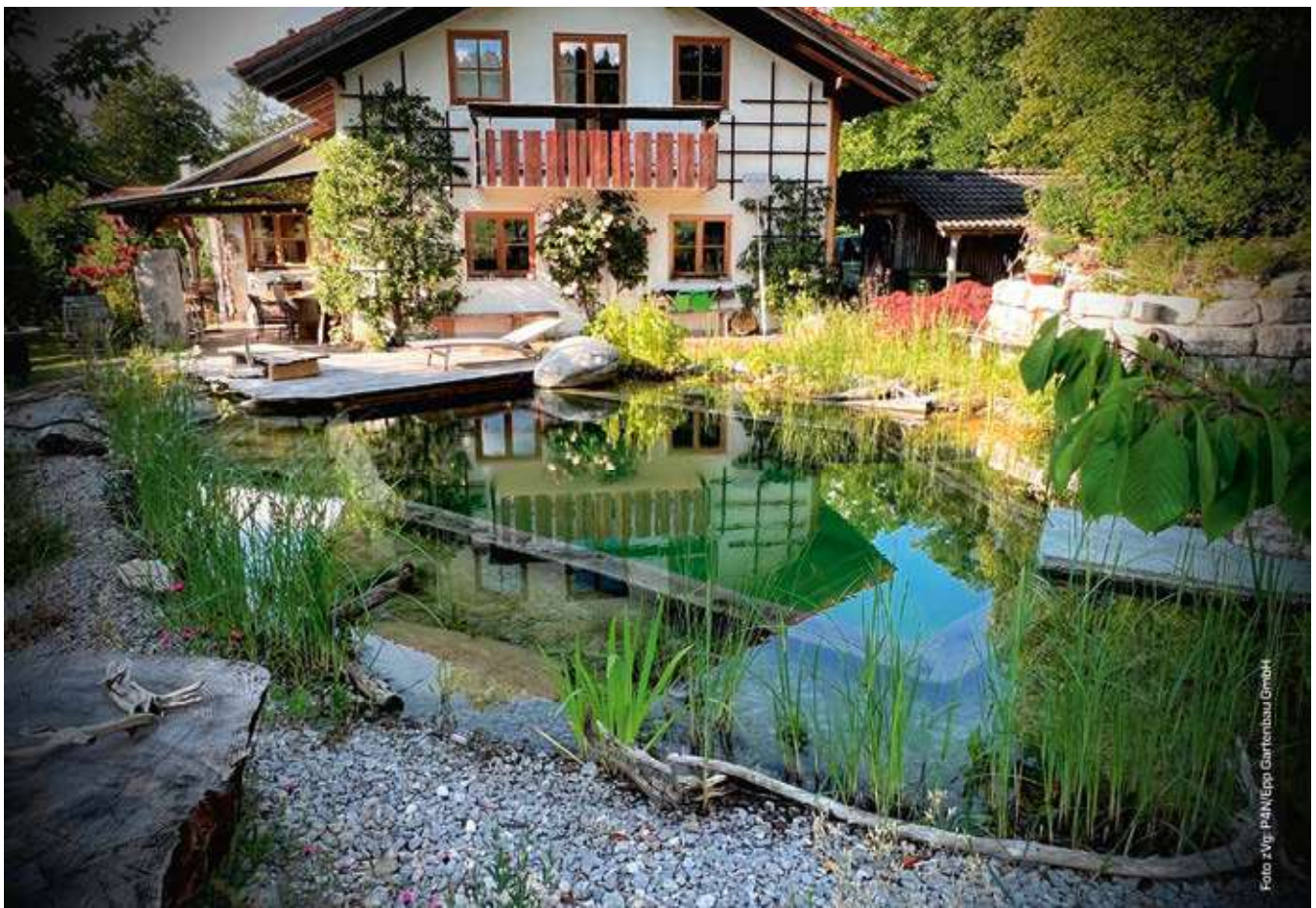
▼ Kategorie Schwimmteich: Epp Gartenbau GmbH, D-83677 Reichersbeuern, www.epp-gartenbau.de