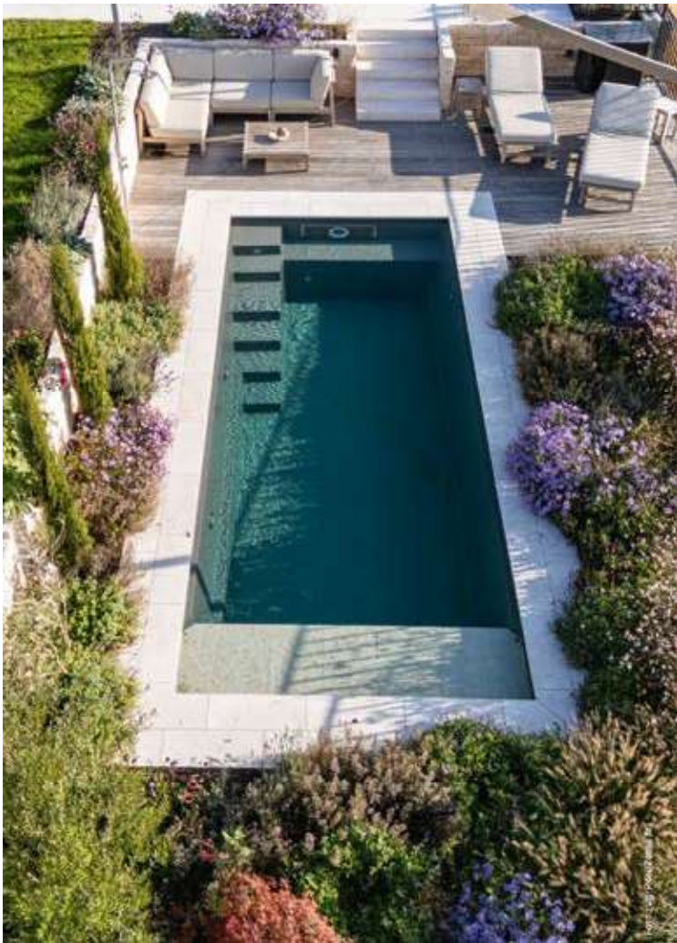
▲ Kategorie Bio Minipool: Zebra AG Garten und Pool, CH-5608 Stetten, www.zebragartenbau.ch