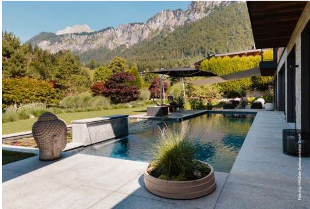
▲ Kategorie Naturpool: Eder Gartenarchitektur GmbH, A-6250 Kundl, www.garten-eder.at

Die Fotos und Videos der Preisträger zeigen eindrucksvoll, wie biologisch aufbereitete Wasseranlagen moderne Gärten in Wohlfühl- und Wellnessoasen verwandeln – ökologisch durchdacht und ästhetisch überzeugend.