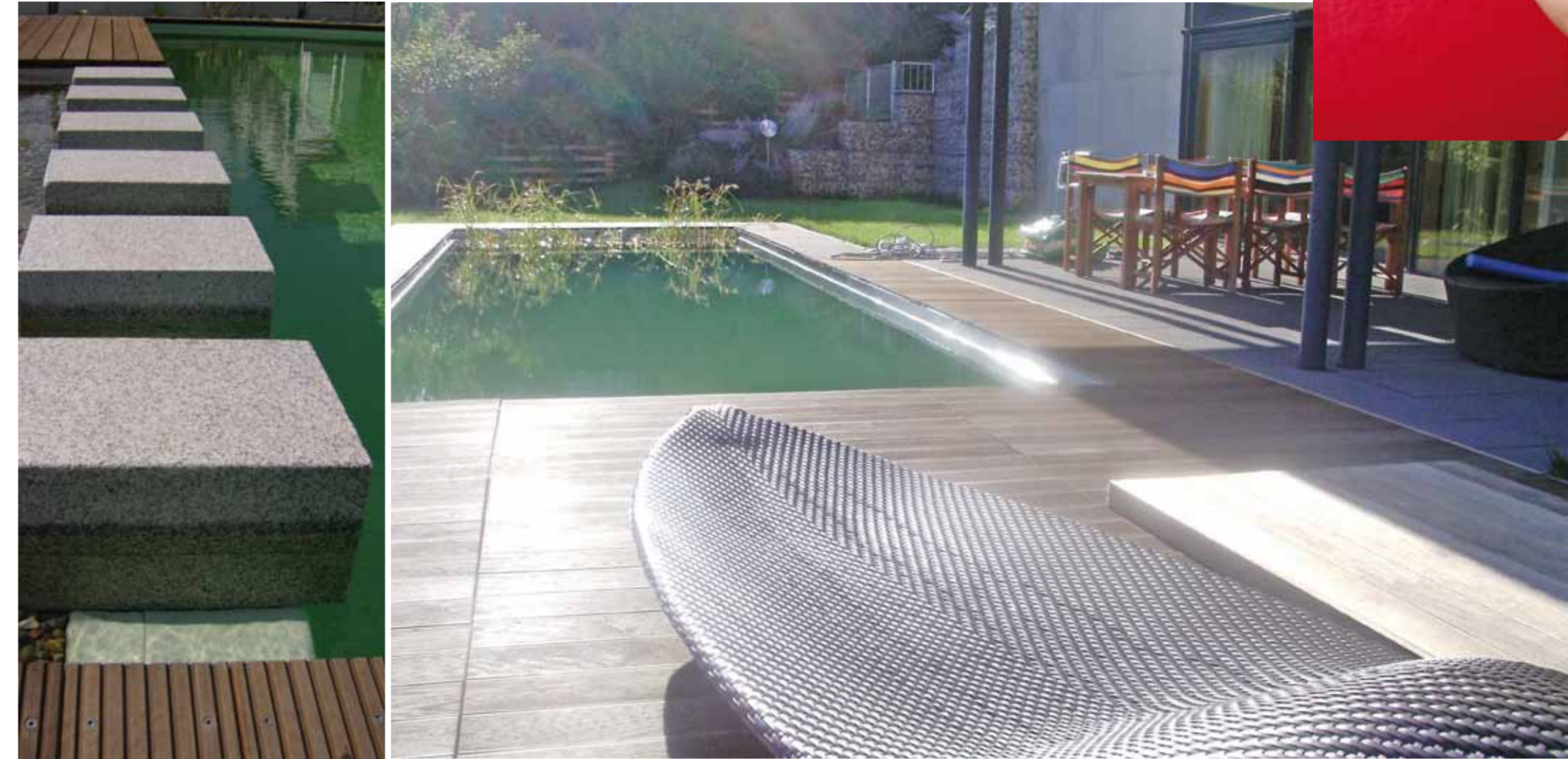
Ungetrübter Badespaß – dank moderner biologischer Wasseraufbereitung.

Der Naturpool verbindet architektonische Linienführung, senkrechte Wände und eine ebene Bodenfläche mit einer hochwertigen biologischen Wasserreinigung. Der Naturpool kann mit jedem Komfort ausgestattet werden, unter anderem mit einer Poolheizung und einer Rolladenabdeckung.